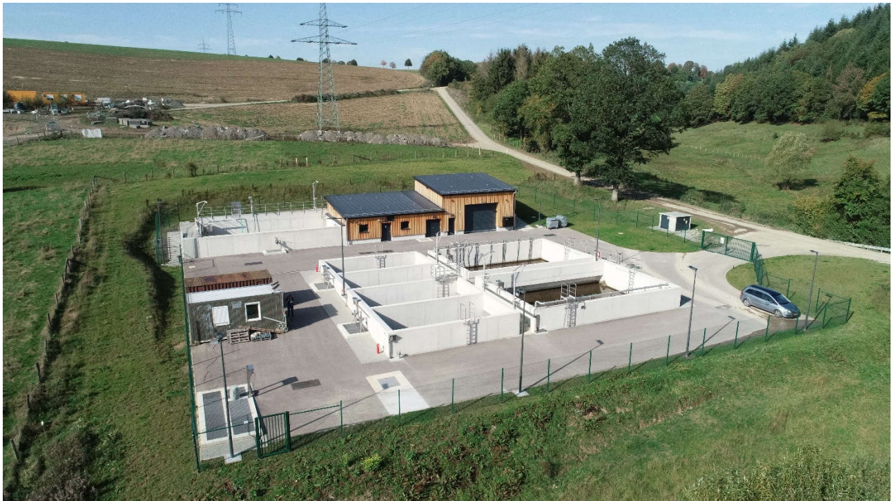
Vue sur la nouvelle station d'épuration à Urspelt