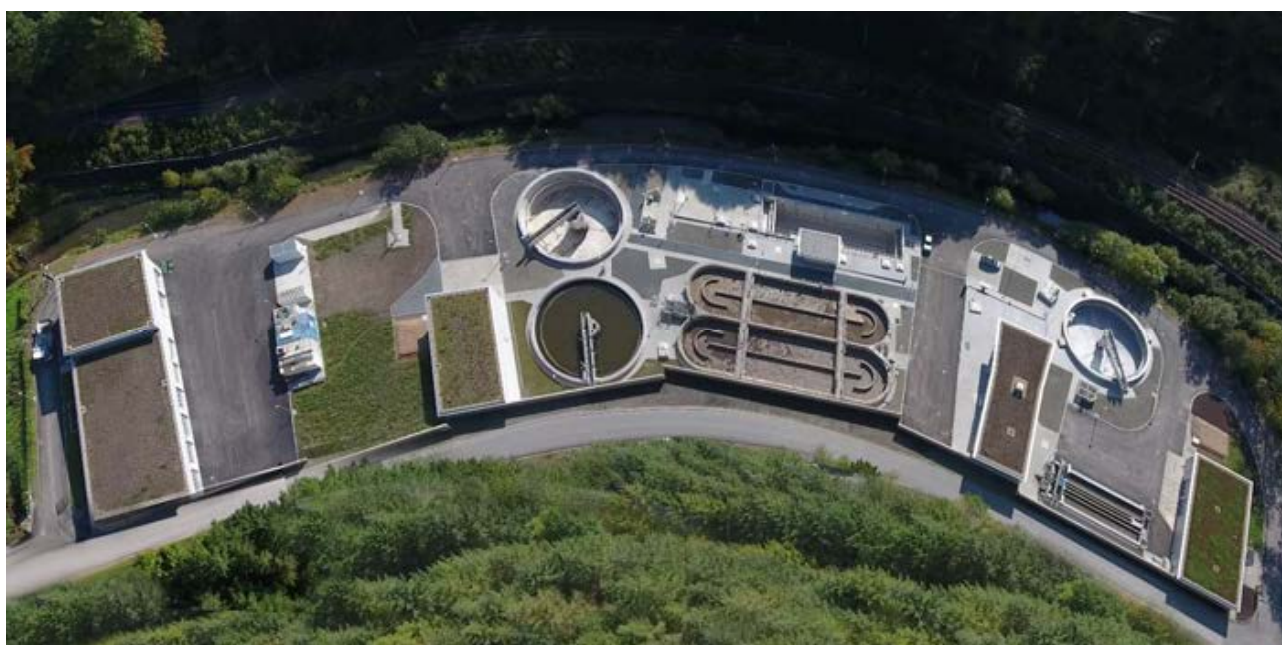
Vue aérienne sur la nouvelle station d'épuration à Wiltz

Les charges polluantes des communes sont reprises dans les tableaux des pages suivantes. Comme types de charges il y a les « pointe » (CPp) et les « moyennes » (CPm), exprimées en EHM étant entendu que les charges de « pointe » (CPp) correspondent aux capacités. « réservées » (CAr). On y a répertorié également les habitants (H). A part la nomenclature des localités figure-t-il également les établissements polluants spécifiques comme par exemple la laiterie Luxlait (Roost), l'ancien site Laduno (Ingeldorf), la décharge contrôlée Sidec (Diekirch), la Brasserie Diekirch , les casernes avec la Cité Militaire du Herrenberg (Diekirch), l'usine Good-Year (Colmar-Berg), l'usine SEO (Putscheid), l' abattoir (Ettelbruck), la brasserie Simon (Wiltz), ... etc. Les systèmes autonomes privés (SAP), soit donc les stations d'épuration et fosses appartenant aux propriétaires de maisons isolées non raccordées à la canalisation publique dotée d'une station de dépollution, sont regroupées par communes sous un site cumulant SAP-Commune .