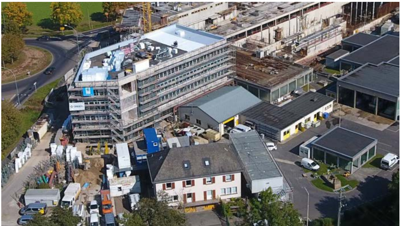
Vue aérienne du chantier « Batiment administratif » à Blesbruck