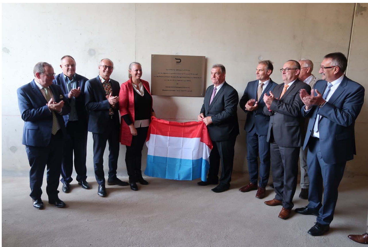
Inauguration de la nouvelle station d'épuration à Blesbruck Phases 1 & 2

Les charges polluantes des communes sont reprises dans les tableaux des pages suivantes. Comme types de charges il y a les « pointe » (CPp) et les « moyennes » (CPm), exprimées en EHM étant entendu que les charges de « pointe » (CPp) correspondent aux capacités. « réservées » (CAR) . On y a répertorié également les habitants (H). A part la nomenclature des localités figure-t-il également les établissements polluants spécifiques comme par exemple la laiterie Luxlait (Roost), l'ancien site Laduno (Ingeldorf), la décharge contrôlée Sidec (Diekirch), la Brasserie Diekirch , les casernes avec la Cité Militaire du Herrenberg (Diekirch), l'usine Good-Year (Colmar-Berg), l'usine SEO (Putscheid), l' abattoir (Ettelbruck), la brasserie Simon (Wiltz), ... etc. Les systèmes autonomes privés (SAP), soit donc les stations d'épuration et fosses appartenant aux propriétaires de maisons isolées non raccordées à la canalisation publique dotée d'une station de dépollution, sont regroupées par communes sous un site cumulant SAP-Commune .