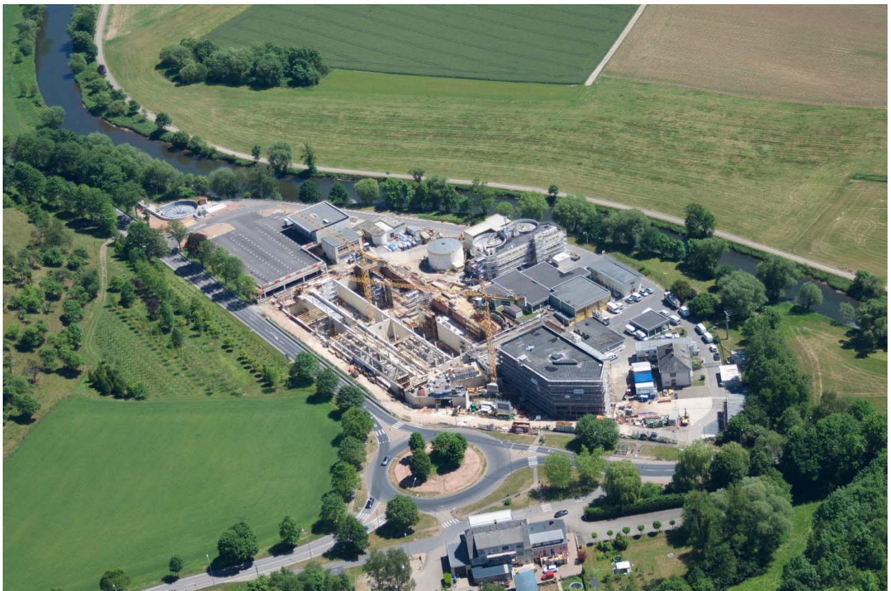
Vue aérienne sur le chantier de la station d'épuration à Blesbruck