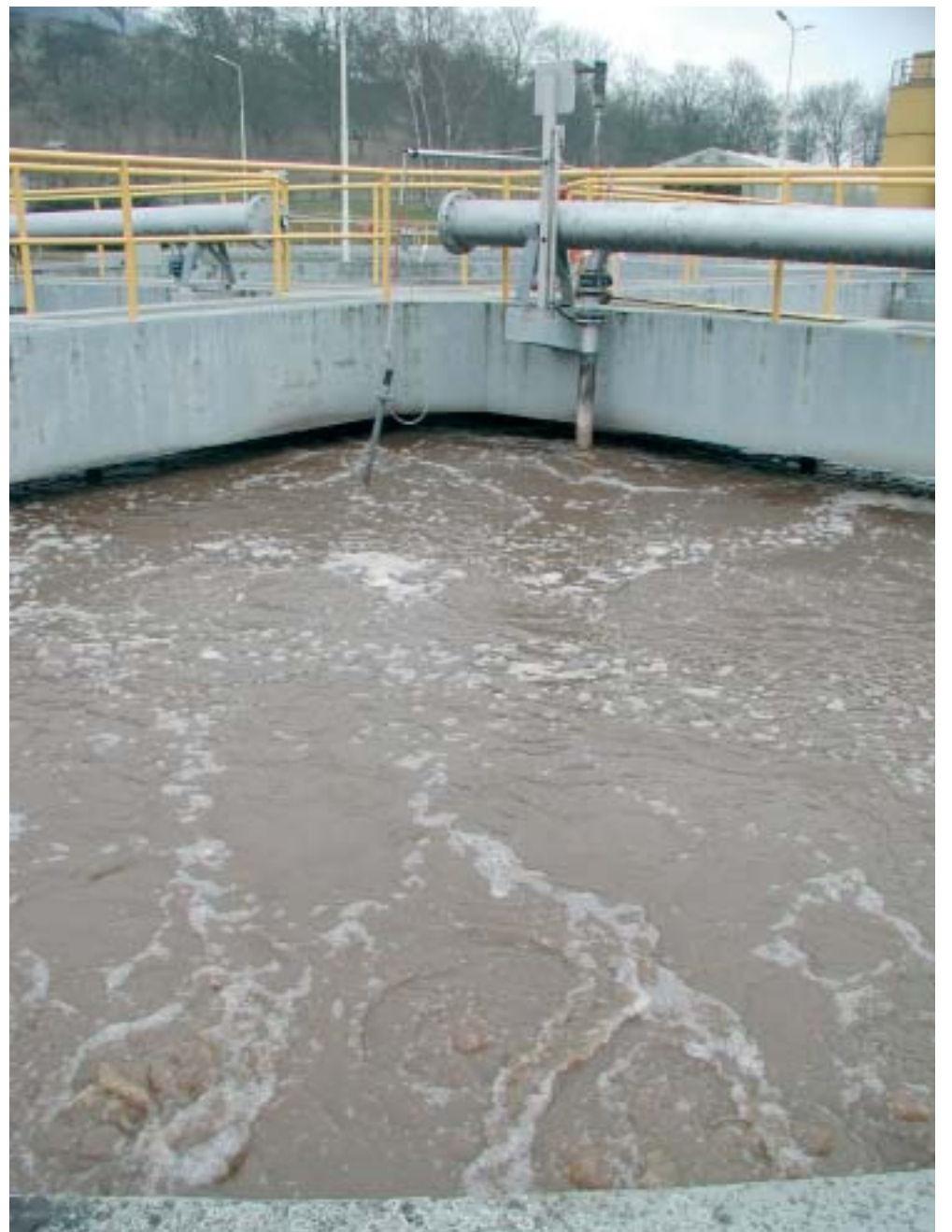
Traitement biologique par les micro-organismes / Biologische Abwasserreinigung durch Mikroorganismen

Ce même règlement exige que les grandes stations d'épuration (>10.000 habitants) soient équipées d'un traitement tertiaire. Priorité est aussi l'aménagement de bassins de rétention et la déconnexion des eaux claires (eau de pluie, de drainage...).