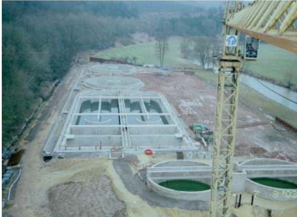
Station d'épuration de Boevange Kläranlage Boewingen

In den luxemburgischen Gemeinden des Attert-Kontraktes sind alle Dörfer an eine Kläranlage angeschlossen. Die Mehrzahl, der in den sechziger Jahren gebauten mechanischen Kläranlagen sind jedoch nicht mehr den heutigen Bedürfnissen und Abwassernormen angepasst. Diejenigen im oberen Teil des Attert-Beckens werden ihrer Funktion entzogen, sobald die gemeinschaftliche Kläranlage in Boewingen den Betrieb aufnimmt. Der Bau dieser Kläranlage hat im Jahr 2000 begonnen. Sie vermag das Abwasser von 15.000 Einwohnern zwischen Beckerich und Boewingen zu fassen (s. Karte). Die Zusammenführung der Abwässer einer grösseren Bevölkerungszahl bringt hier den Vorteil dass sich die Mehrkosten für die Installation einer dritten Reinigungsstufe lohnen (s. Glossar). Die mechanischen Kläranlagen im unteren Teil des Attert-Beckens (Roost und Bissen), werden ebenfalls zu Gunsten eines Anschlusses an die regionale Kläranlage in Diekirch/Bleesbruck stillgelegt.