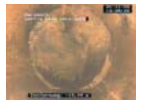
Domages causés par un affaissement du sol ou par des racines à l'intérieur de la canalisation / Schäden im Innern der Kanalisation durch Bodenabsackung oder Wurzelwuchs